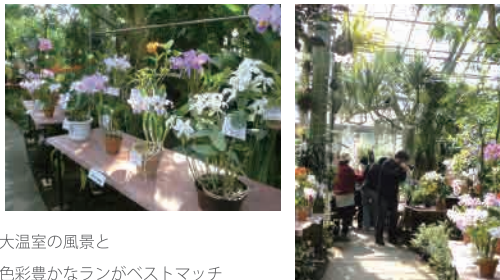
大温室の風景と 色彩豊かなランがベストマッチ