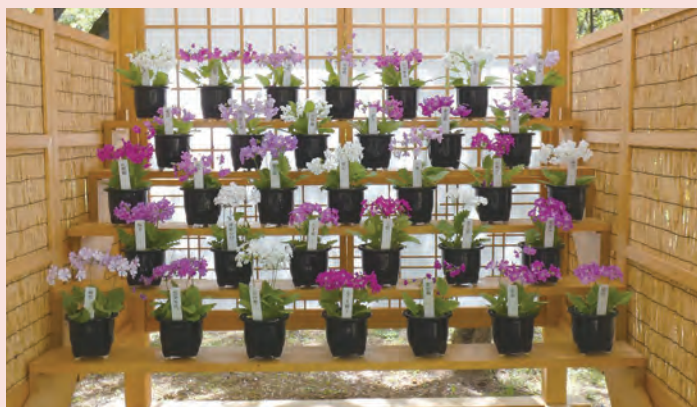
①桜草花壇：江戸時代に考案された観賞方法

1種の野生種から作出されたとは思えないほどの多彩な色、形、姿をお楽しみください。