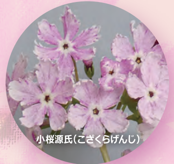
小桜源氏(こざくらげんじ)