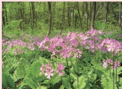
サクラソウの自生地の様子

さくらそうとはどのような植物か？野生のサクラソウから、さくらそう栽培の歴史、園芸品種の由来と成立までを、パネルで解説します。