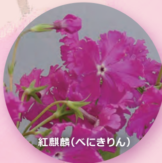
紅麒麟(べにきりん)