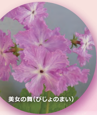
美女の舞(びじょのまい)