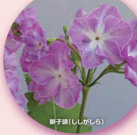
獅子頭(ししがしら)