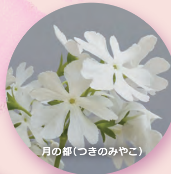
月の都(つきのみやこ)