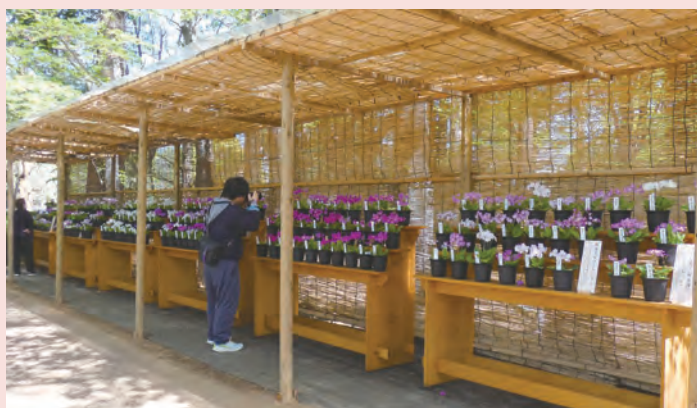
②会期中は、100種類以上の園芸品種をご覧ください