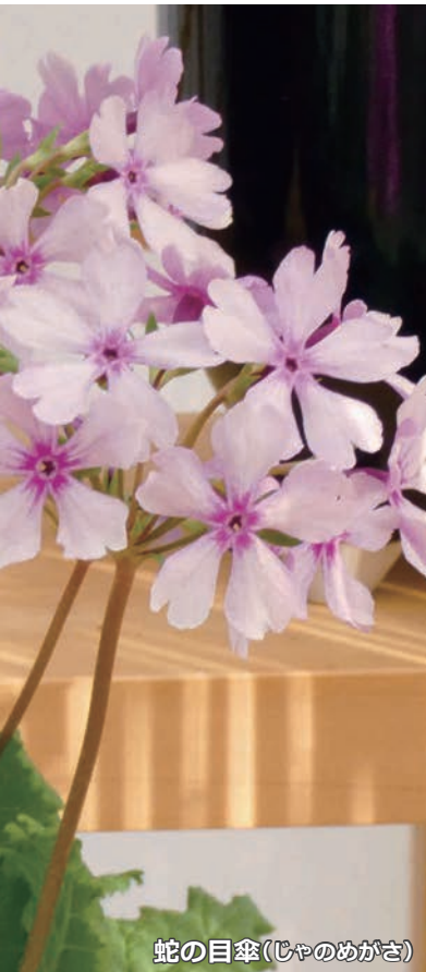
蛇の目傘(じゃのめがさ)