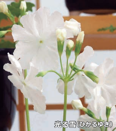
光る雪(ひかるゆき)