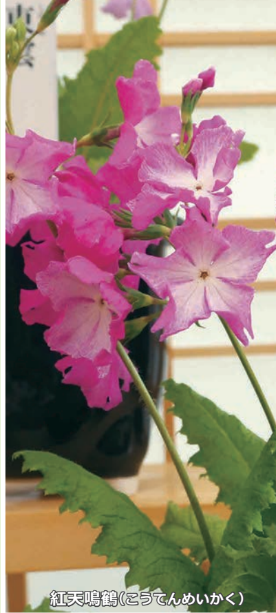
紅天鳴鶴(こうてんめいかく)