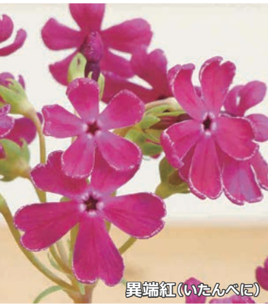
異端紅(いたんべに)