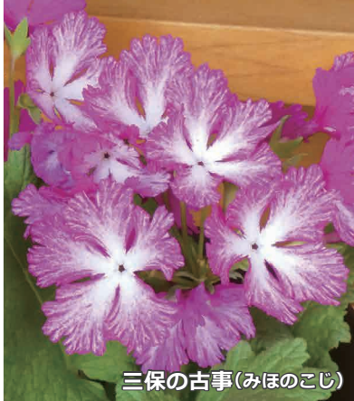
三保の古事(みほのこじ)