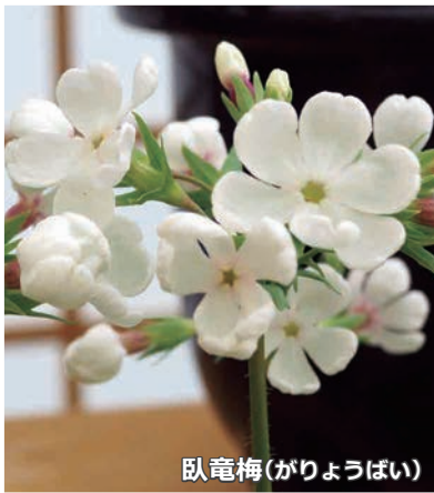
臥竜梅(がりようばい)