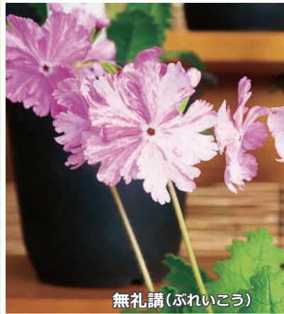
無礼講(ぶれいこう)