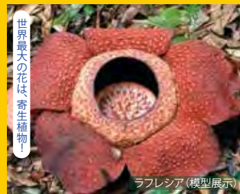
世界最大の花は 奇生植物