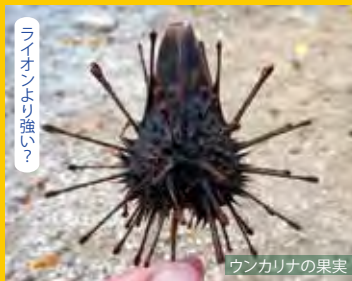
ライオンより強い?