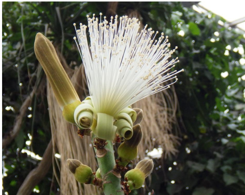
3位 プセウドボンバックス・エリプティクム