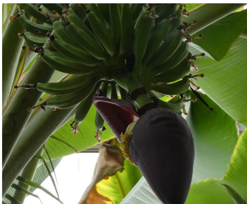
トピックス バナナ