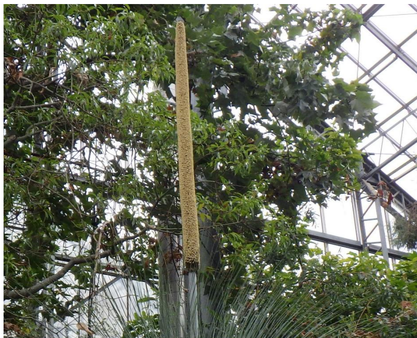
1位 クサントロエラ・グラウカ