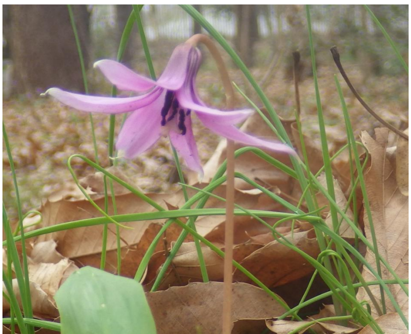
3位・トピックス カタクリ