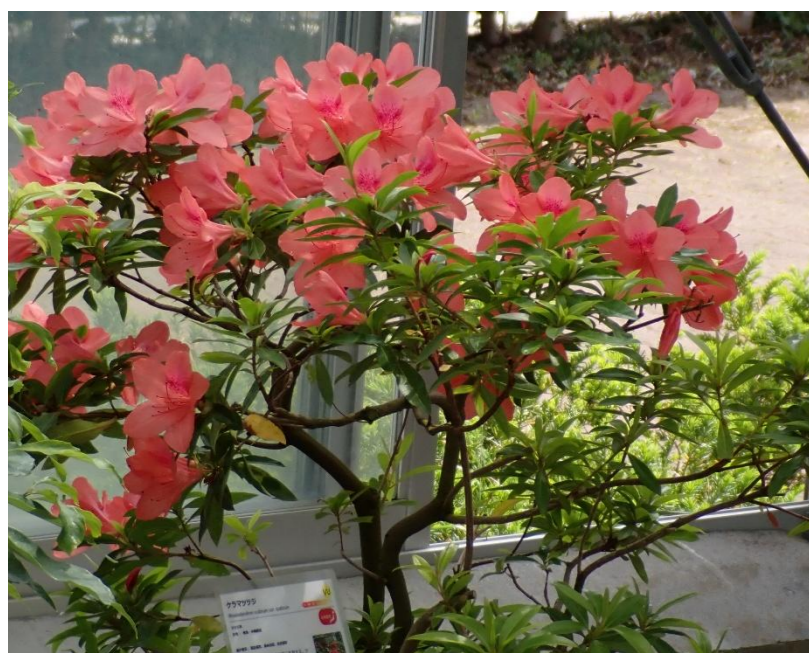
1位 琉球の植物各種